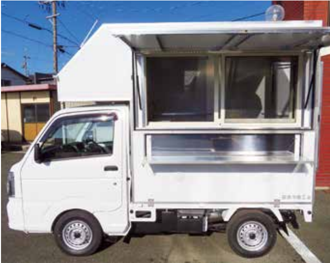
【車両：軽トラック 1台】