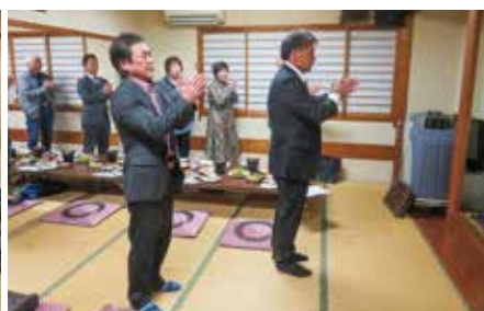
【南支部】 11月25日（火） まるわか