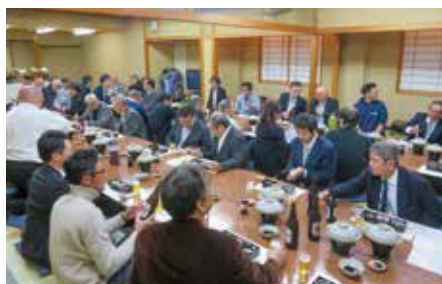
【北支部】 11月21日（金） 若草