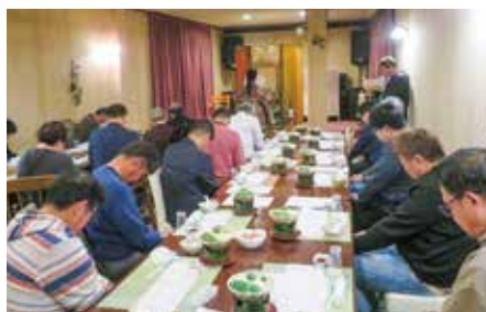
【東支部】 11月21日（金） 八百重商店

商売の神様とされる恵比寿様を祀り、今後の商売繁盛とご健勝を祈願しての拝礼を行いました。