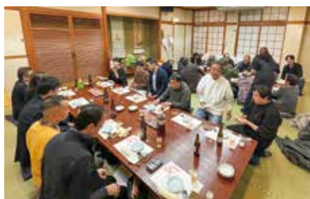
【中支部】 11月26日（水） グリル華