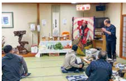
【西支部】 11月21日（金） マルト清水屋