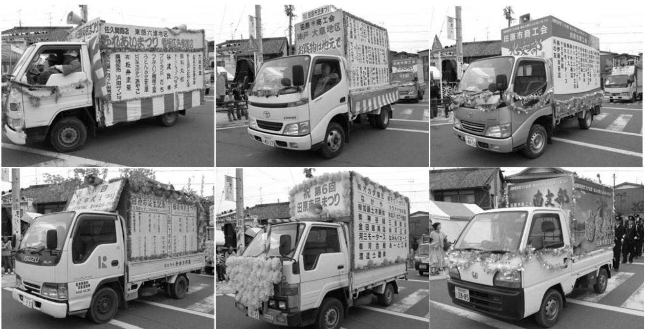
各支部パレード車