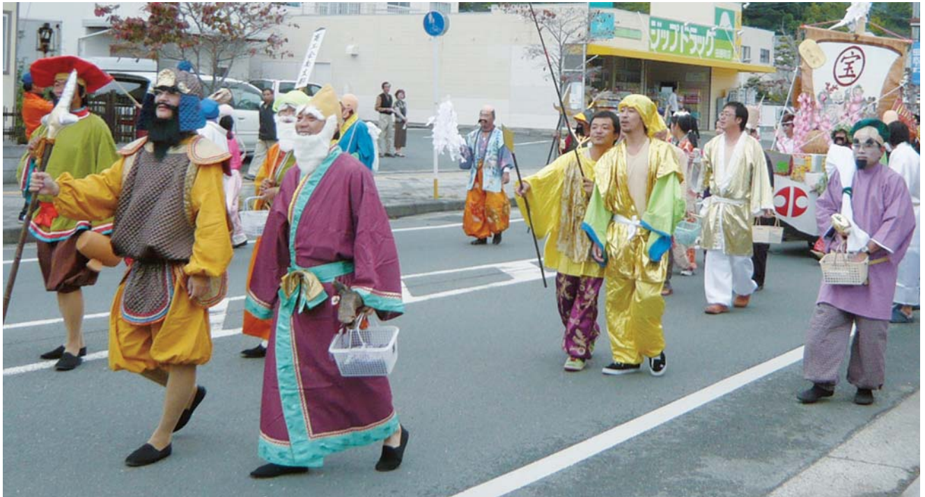
10月26日 華山の郷土ふれあいまつり