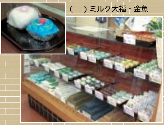
( ) ミルク大福・金魚

場 所 田原市大久保町 T E L 22 - 3761 定 休 日 月曜日 営業時間 午前7時30分～午後7時30分