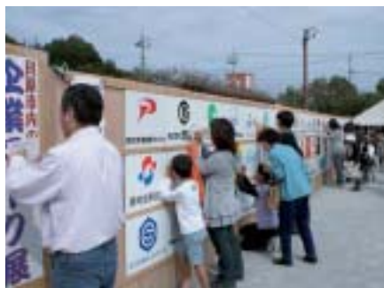
企業マーククイズ