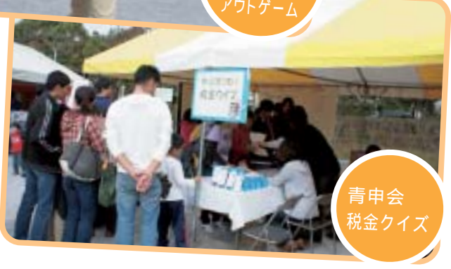
青申会 税金クイズ

この他に各地区・支部、会員の方々にご出店いただき盛況なテント村となりました。ご協力ありがとうございました。