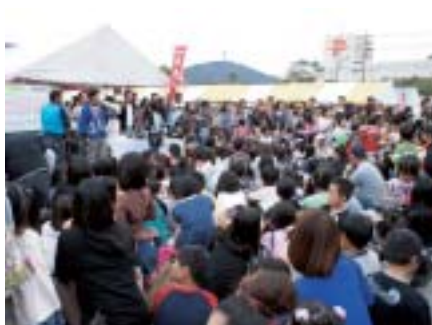
子供向けビンゴゲーム