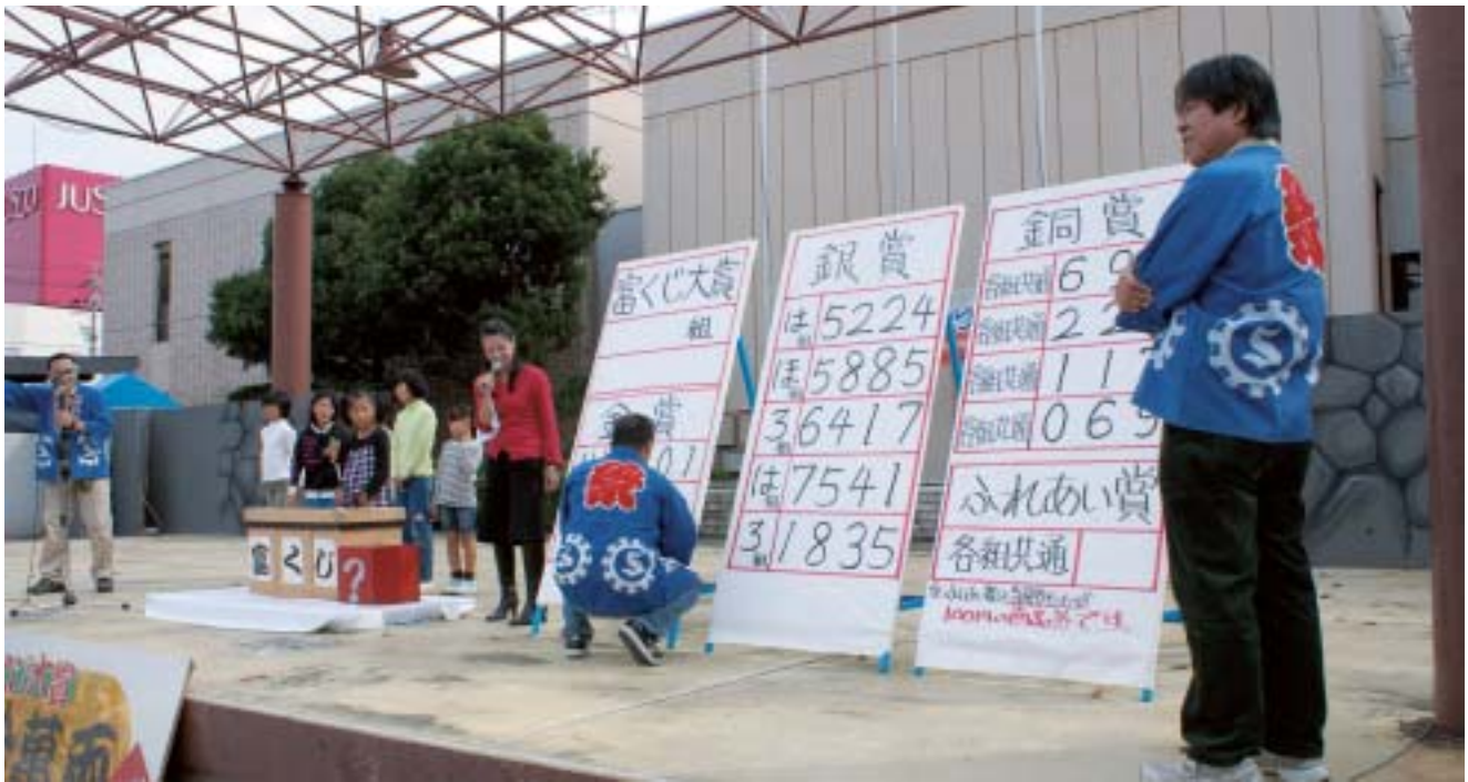
10月25日 華山の郷土ふれあいまつり