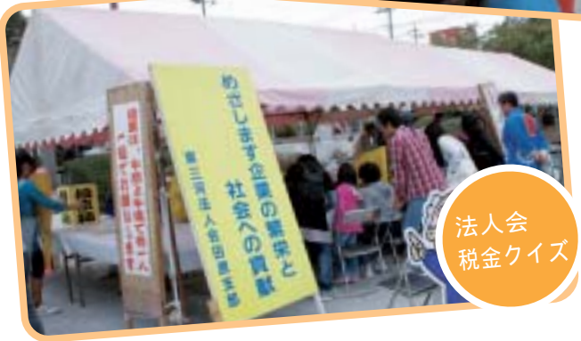
法人会 税金クイズ