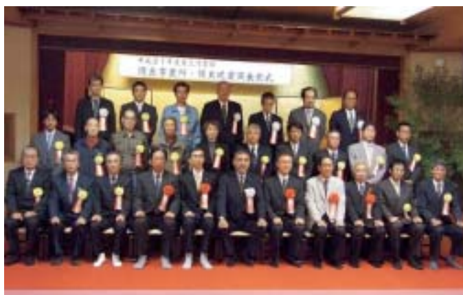
(平成21年度 東三河支部表彰式 H21.10.15)