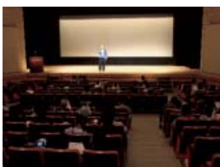
華山劇DVD観賞会(文化ホール)