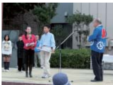
田原三山賞表彰式