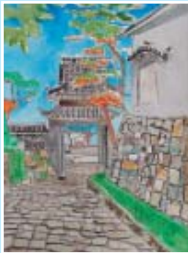
わし やま りょう 鷺山 諒 (清田小学校 6年)