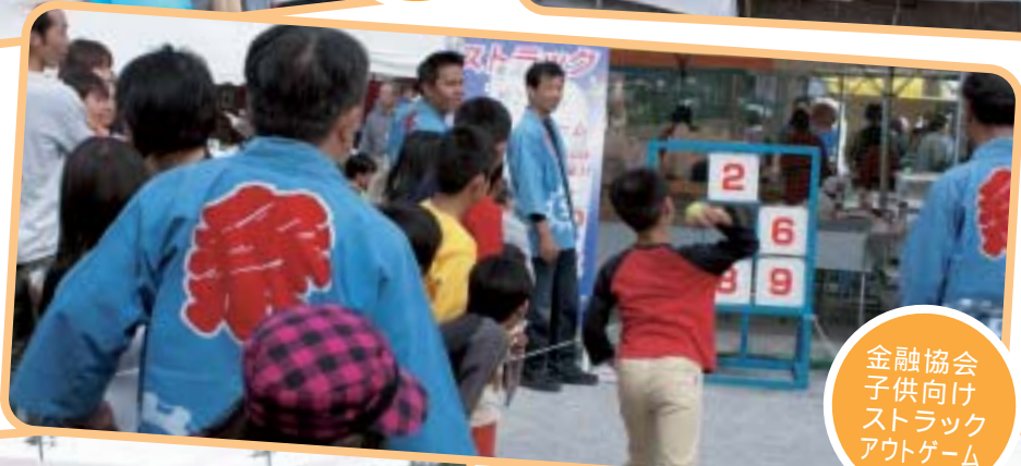
金融協会 子供向け ストラック アウトゲーム