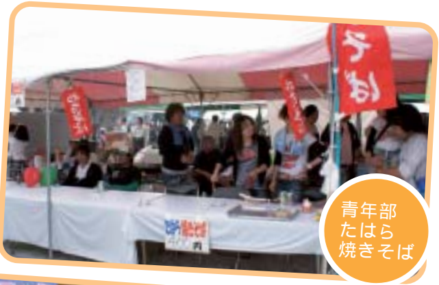
青年部 たはら 焼きそば