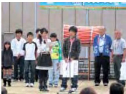
田原三山賞表彰式