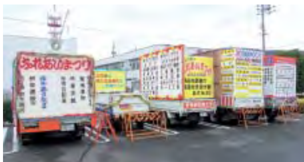
商工会支部パレードカー