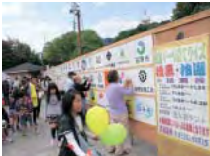
法人会企業マーク当てクイズ