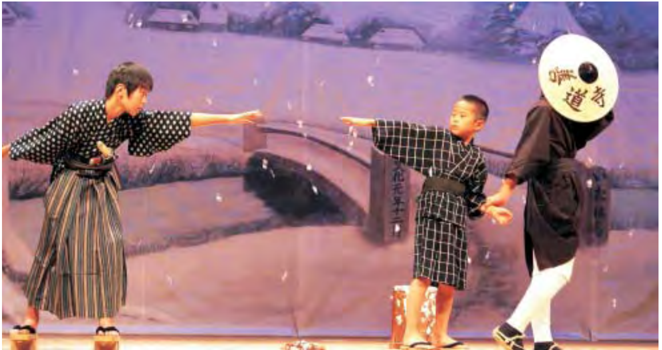
10月23日 華山の郷土ふれあいまつり(華山劇)