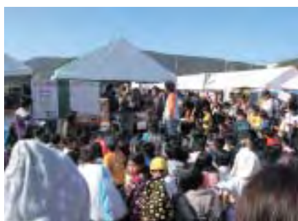
青年部子供向けビンゴゲーム