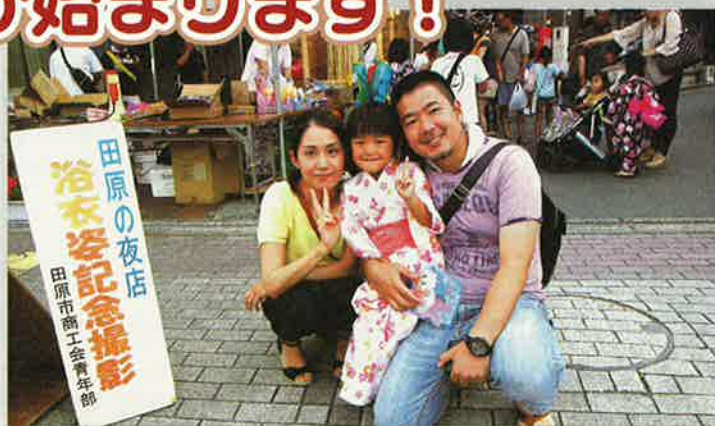
※写真は昨年の夜店の様子です