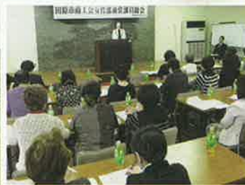
前女性部役員の皆様、2年間お疲れ様でした。