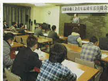
前青年部役員の皆様、2年間お疲れ様でした。