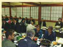
南支部恵比寿講 11月19日(月曜日) 大浜屋