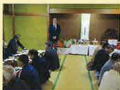
西支部恵比寿講 11月17日(月曜日) かにや