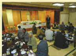
東支部恵比寿講 11月24日(火曜日) めっくんはうす

各支部で恵比寿講が開催されました。商売の神様とされるえびす様を祀り、商売繁盛とご健勝を祈願しての拝礼。その後懇親会に移りました。