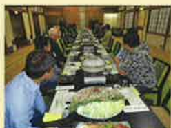
中支部恵比寿講 11月16日(月曜日) 大谷屋旅館