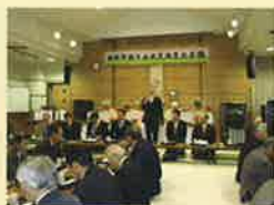
北支部恵比寿講 11月20日(金曜日) 浦区ふれあいセンター