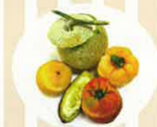
【野菜ジェラート】 (榑ミマス/福井かをり)