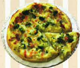
【メロンとさつまいものデザートピッツァ】 (榑) ユン・グ リン/奥田順子)