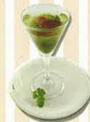
【お野菜inゼリー】 (風雅/渡辺隆志)