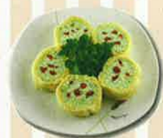
【田原野菜のロールケーキ】 (資)雅 風/藤井恵美子)