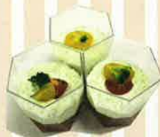
【トマトのカラフルゼリー】 (資)雅 風/藤井恵美子)