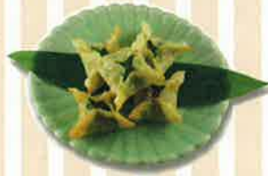
【大葉魚〜ざ】 (鈴木屋/鈴木ルリ子)