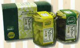
【ブロッコリーの旨み漬け】 (尙福忠/井上尚)