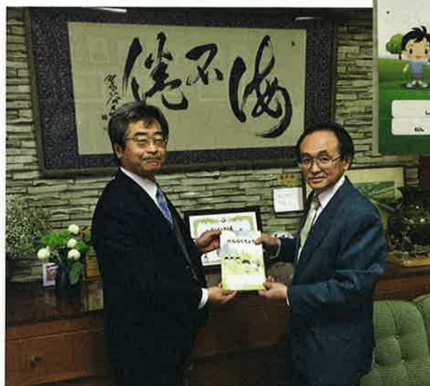
(衣笠小学校へ事業委員長が代表で贈呈)