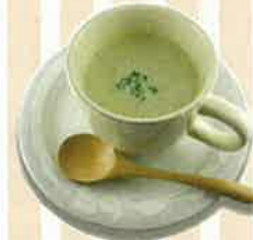
【野菜スープ】 (喫茶ピア/鈴木典子)