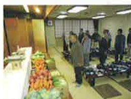
東支部恵比寿講 11月25日(金) めっくんはうす

各支部で恵比寿講が開催されました。商売の神様とされるえびす様を祀り、商売繁盛とご健勝を祈願しての拝礼をし、その後懇親会に移りました。