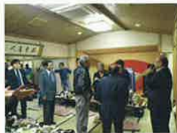
南支部恵比寿講 11月22日(火) 鈴木屋