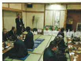
中支部恵比寿講 11月25日(金) こも天