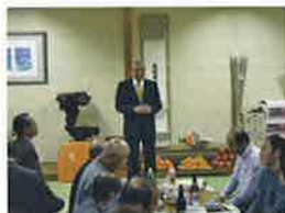
西支部恵比寿講 11月17日(木) マルト清水店