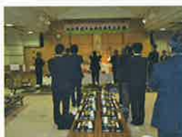
北支部恵比寿講 11月18日(金) 浦区ふれあいセンター