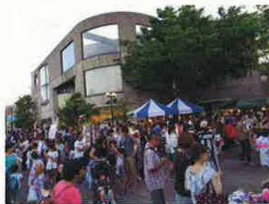
はなとき通り会場