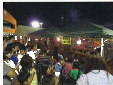
あかばねロコステーション会場