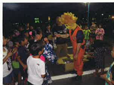
めっくんはうす会場

開催日：平成29年7月1日(土) めっくんはうす 主催：田原市商工会 7月8日(土) はなとき通り 主管：田原市商工会青年部、 7月15日(土) はなとき通り 田原旭町通り商店街(協)、 7月22日(土) あかばねOKステーション (株)田原観光情報サービスセンター