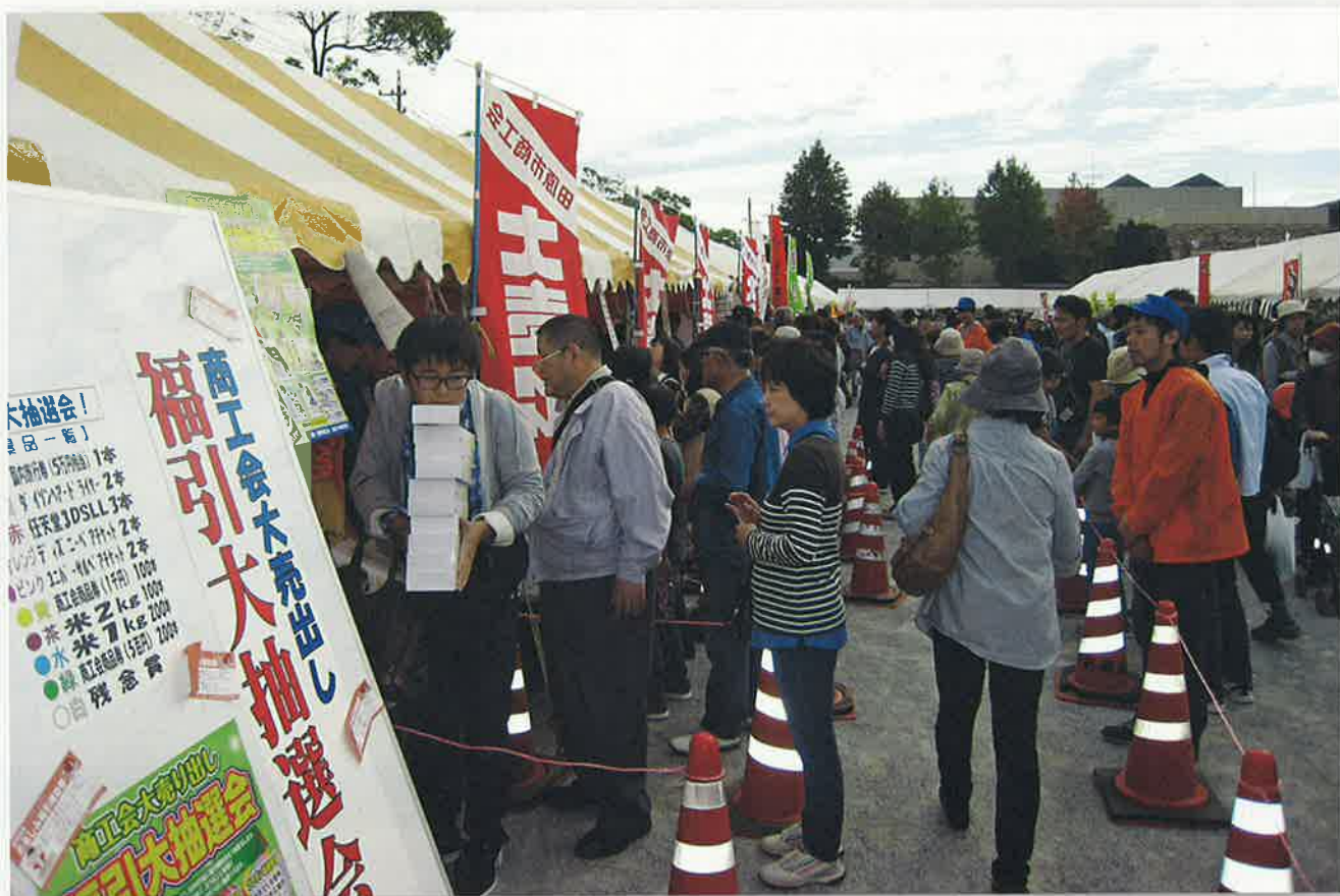
(写真は昨年のふれあいまつりの様子です)

発行：田原市商工会 〒441-3421 田原市田原町倉田10番地2 TEL.22-6666(代) FAX.23-0419 URL http://www.tahara.or.jp/ メールアドレス：tahara@tahara.or.jp