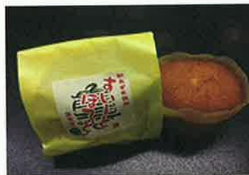
亀若すいーとぼてと