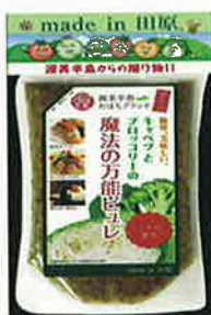
魔法の万能ピュレ