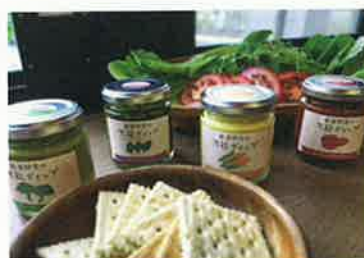
田原野菜のディップ