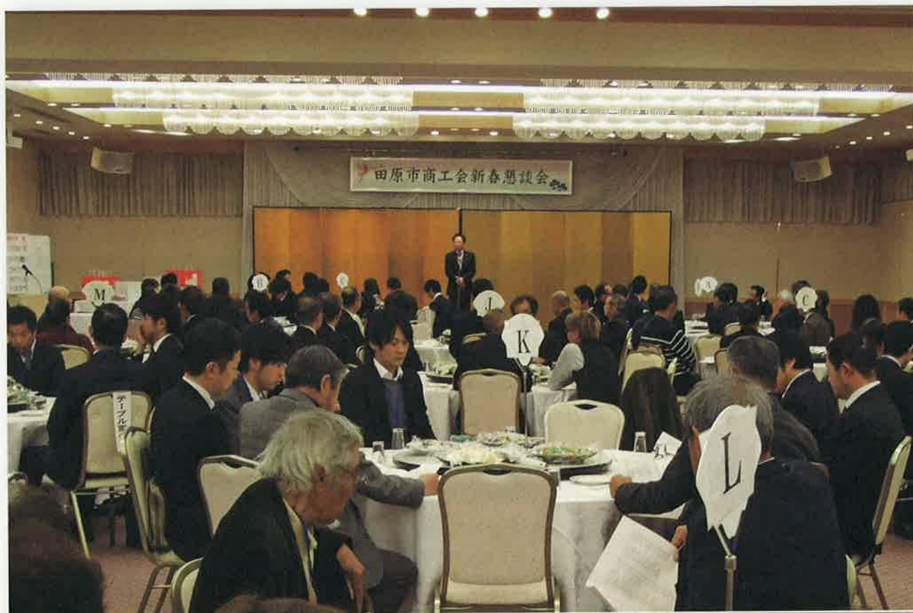
(昨年度の懇談会風景)

発行：田原市商工会 〒441-3421 田原市田原町倉田10番地2 TEL.22-6666(代) FAX.23-0419 URL http://www.tahara.or.jp/ メールアドレス：tahara@tahara.or.jp