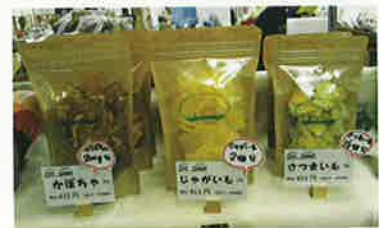
田原野菜のドライサラダ