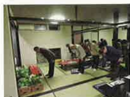
東支部恵比寿講 11月20日(月) 和味旬彩よしの

各支部で恵比寿講が開催されました。商売の神様とされるえびす様を祀り、商売繁盛とご健勝を祈願しての拝礼をし、その後懇親会に移りました。