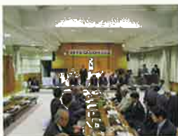
北支部恵比寿講 11月17日(金) 浦区ふれあいセンター