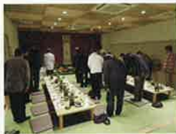
中支部恵比寿講 11月24日(木) 大谷屋食堂