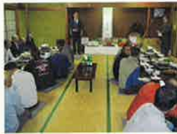
西支部恵比寿講 11月17日(金) かにや