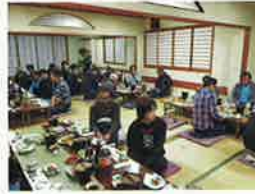
南支部恵比寿講 11月21日(火) まるわか