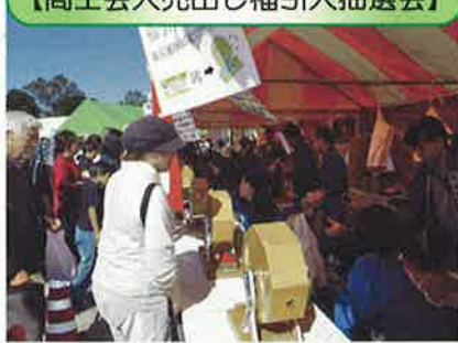
【商工会大売出し福引大抽選会】